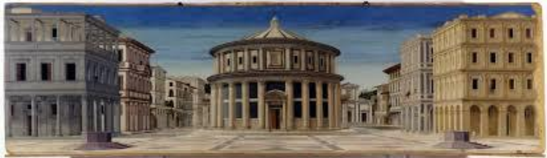
Anonimo fiorentino (forse Piero della Francesca), la città ideale (si noti la prospettiva del disegno e la proporzione geometricamente perfetta dei palazzi)

Nella pittura accanto a ciò, si scopre la prospettiva , cioè la terza dimensione della profondità nel disegno. In tal modo si realizza pienamente quella imitazione della natura nel cui ordine tutti gli oggetti sono collocati al loro posto e lo sguardo riesce a coglierli nelle loro relazioni autentiche con lo spazio che li circonda.