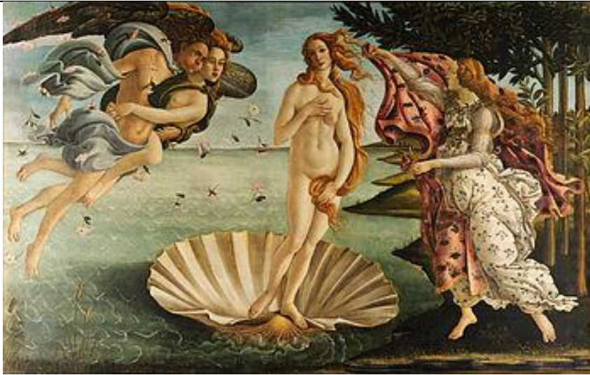
Botticelli, la nascita di Venere