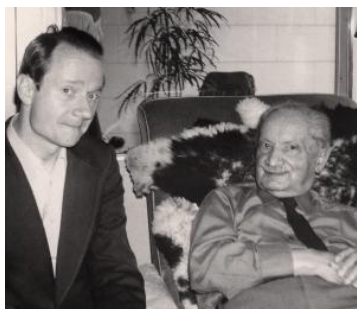
Il prof. Alfieri con Martin Heidegger

“La stampa italiana, al pari di quella tedesca, ha scelto, nella maggioranza dei casi, di allinearsi alla via più ovvia e politicamente corretta, delle strumentalizzazioni ideologiche. Tale scelta è stata determinata dalla necessità di far presa sulle masse e accreditare sempre più, presso il grande pubblico, le tesi preconcepite dei sostenitori di queste strumentalizzazioni. Del nostro libro si è comunque parlato, nonostante il voluto silenzio dei giornali schierati a sinistra e al servizio del potere culturale