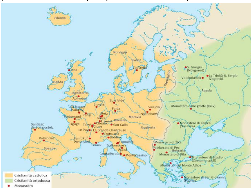
I monasteri, centri di diffusione del cristianesimo nell'alto medioevo

In una situazione di caos interno, in cui dall'esterno premono popolazioni agguerrite, che promuovono incursioni e causano devastazioni dalle quali le popolazioni europee fanno fatica a trovare adeguata protezione, il disorientamento generale trova un freno e un argine nelle strutture della Chiesa. Il cristianesimo cattolico è egemone nella società europea. L'organizzazione della Chiesa in essa rappresenta l'unica forma di struttura amministrativa efficace, perché raccoglie l'eredità delle strutture dell'Impero romano (per esempio lo stesso termine "diocesi" che indica una porzione di territorio abitato da una popolazione cristiana e affidato alle cure di un vescovo, era stato mutuato dalle articolazioni territoriali e amministrative dell'Impero). Altresì la Chiesa costituisce una riserva di personale che possiede cultura scientifica, filosofica, giuridica e politica, che essa ha potuto ricevere in eredità dal passato romano e che custodisce gelosamente nelle sue istituzioni monacali. Tutto ciò fa della Chiesa un punto di riferimento ineliminabile della società medievale, determinando talora una rivalità concorrenziale con l'autorità politico-militare con la quale pur deve convivere e spesso collaborare.